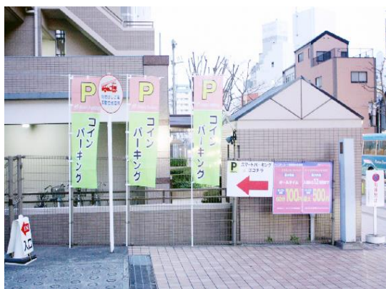
スマートパーキングの入り口画像

兵庫県住宅供給公社はまず団地内の空き駐車場に、試験的にスマートパーキングを導入し、稼働状況や収益性などについて、他のサービスなどとも比較評価し、実績が良好であれば今後の拡大も視野に入れていきます。