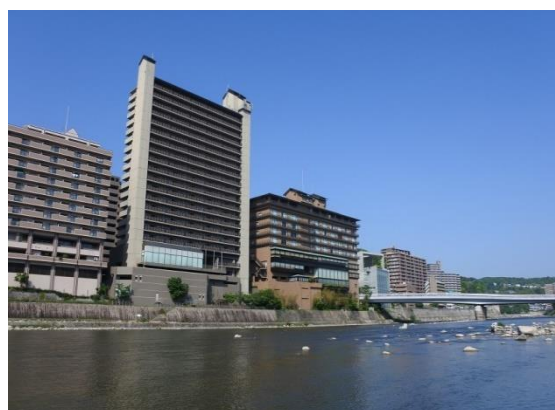
兵庫県住宅供給公社物件の例 (アメニティコート宝塚湯本)