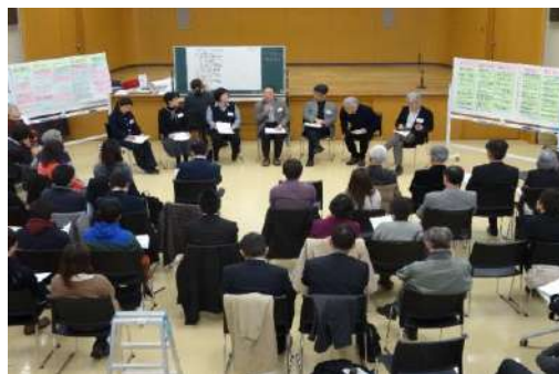
地元住民と明舞団地再生の話し合い