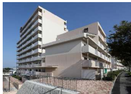
県営明石松ヶ丘建替事業（第5期）