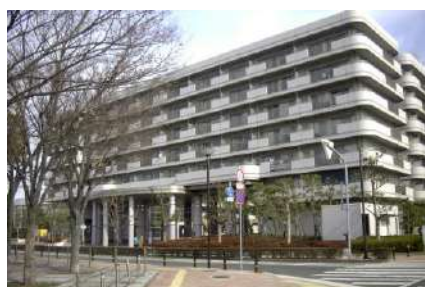
パストラル加古川