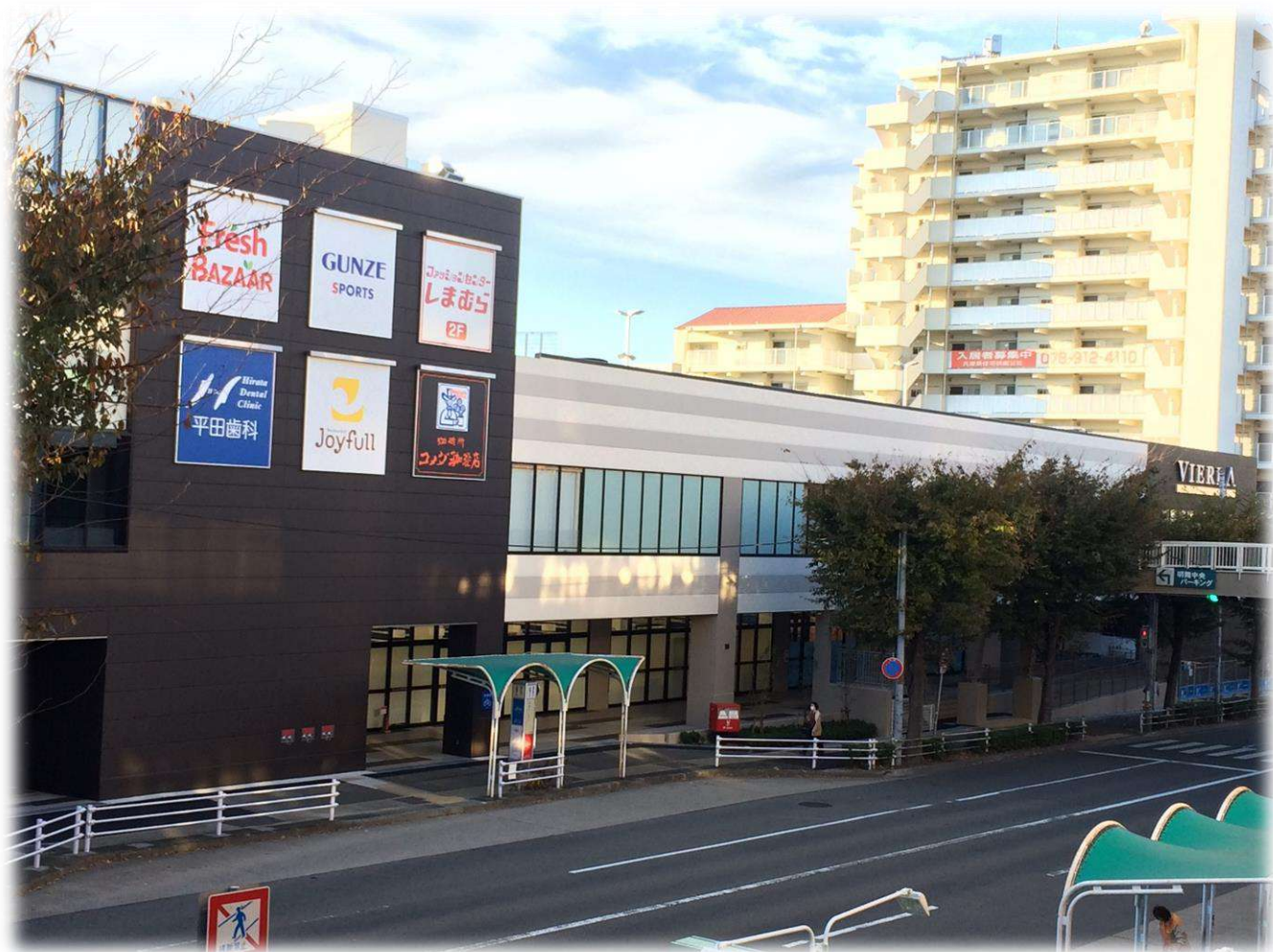
明舞団地センター地区「ビエラ明舞」と「アメニティコート明舞」