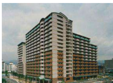
[マンションタイプ] アメニティコート西宮北口