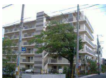
[マンションタイプ] アメニティコート岡本