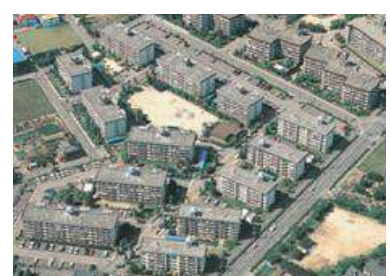
[団地型] 宝塚安倉団地