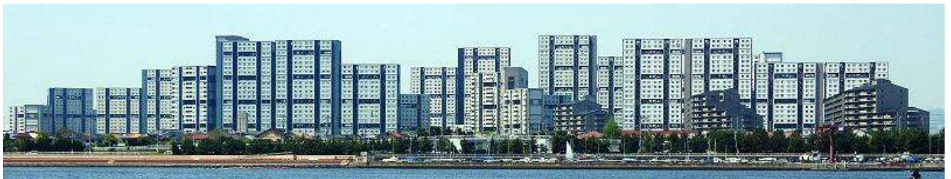
[団地型+マンションタイプ] 芦屋浜高層住宅

兵庫県の特別法人だから安心 ・安心の管理体制 ・ほとんどが鉄筋コンクリート造、災害時も安心 ・退去時の費用負担区分が明確だから安心